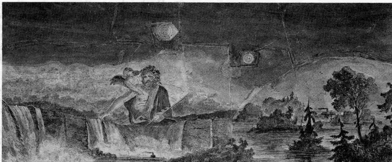
Los collages son obra de Vivian Torrance y fueron publicados originalmente en Chemistry Imagined , Smithsonian Institute, Washington, 1994.